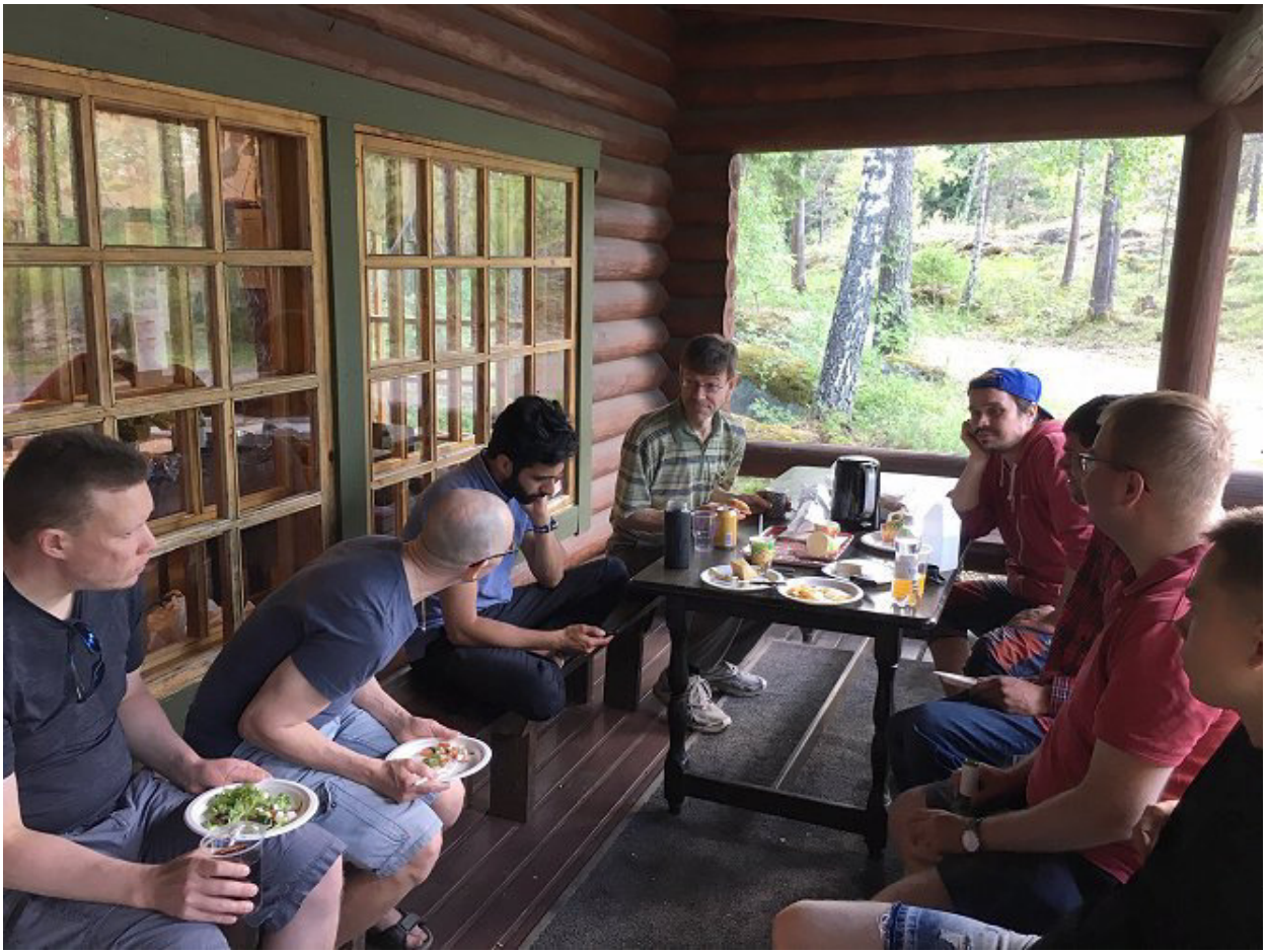
Ruokailuhetkeä vuodelta 2018